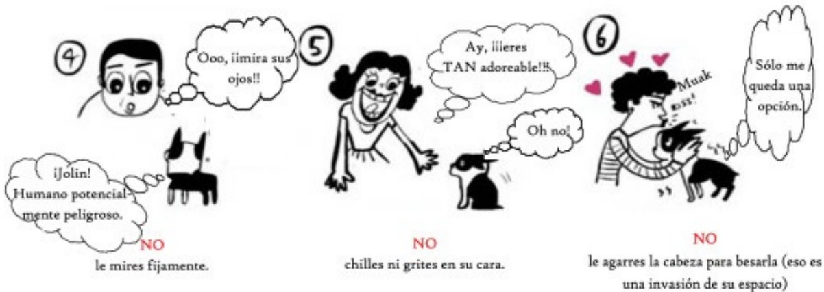
NO le mires fijamente.