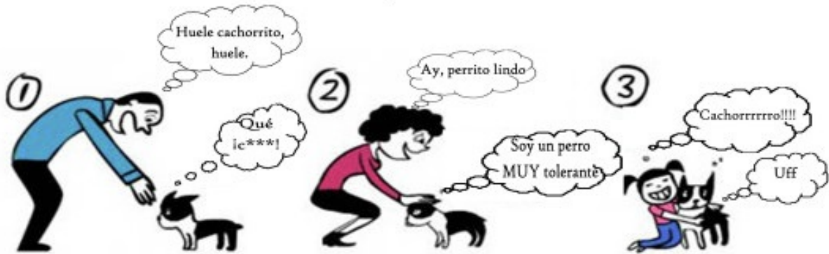
NO te agaches sobre el perro ni metas la mano en su cara

La mayoría de la gente hace esas cosas y estresa a algunos perros. Da igual lo mono que tú (o tu hijo) crees que es Pancho, por favor respétalo.