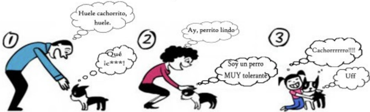
NO te agaches sobre el perro ni metas la mano en su cara

La mayoría de la gente hace esas cosas y estresa a algunos perros. Da igual lo mono que tú (o tu hijo) crees que es Pancho, por favor respétalo.