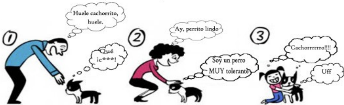
NO te agaches sobre el perro ni metas la mano en su cara

La mayoría de la gente hace esas cosas y estresa a algunos perros. Da igual lo mono que tú (o tu hijo) crees que es Pancho, por favor respétalo.