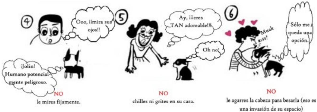
NO le mires fijamente.