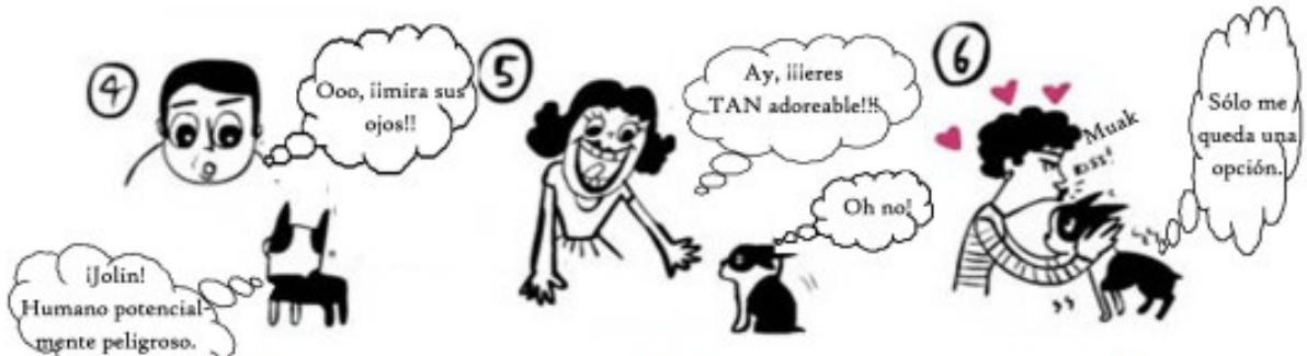
NO le mires fijamente.