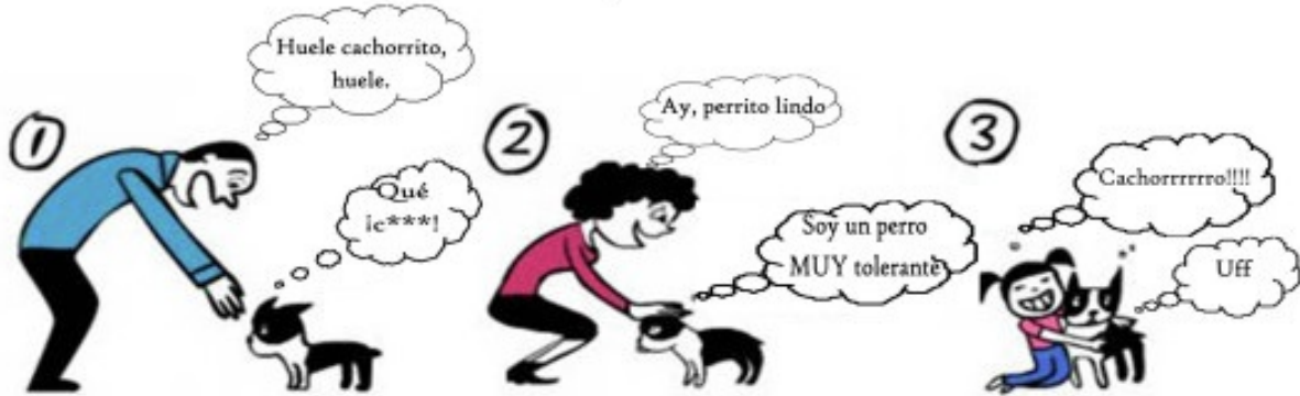
NO te agaches sobre el perro ni metas la mano en su cara

La mayoría de la gente hace esas cosas y estresa a algunos perros. Da igual lo mono que tú (o tu hijo) crees que es Pancho, por favor respétalo.