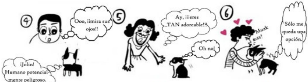
NO le mires fijamente.